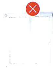
PVC profily – IT lišty, plastová okna