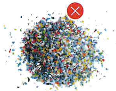
Plastový granulát (z průmyslové výroby plastů)