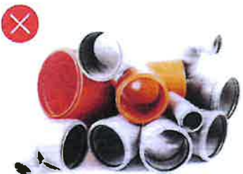
Novodurové vodovodní trubky Kanalizační trubky