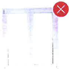
PVC Rámy plastových oken