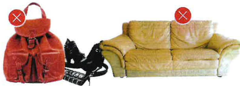
Koženka s textilem (nábytek, kabelky, oděvy, boty)