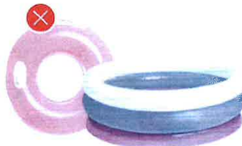
Zahradní bazény a fólie