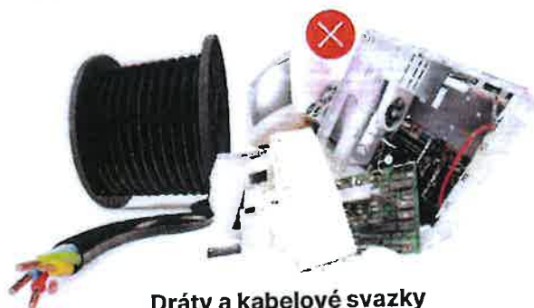
Dráty a kabelové svazky izolační materiály a elektroodpad