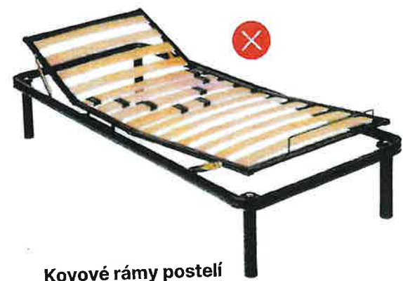
Kovové rámy postelí