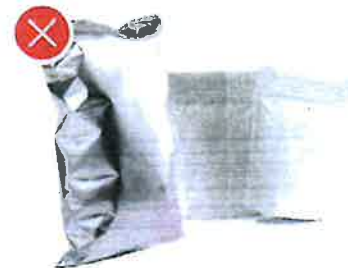
Kompozitní obaly s vnitřní hliníkovou fólií