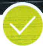
Sedačky včetně látkových potahů