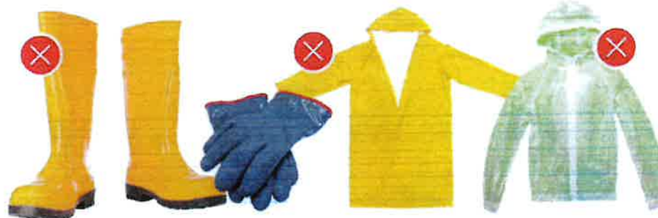
Pryž (guma) – obuv, oblek, rukavice