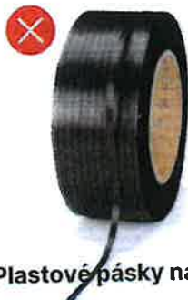
Plastové pásky na balení