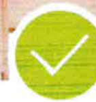
Nábytkové stěny bez skleněných výplní