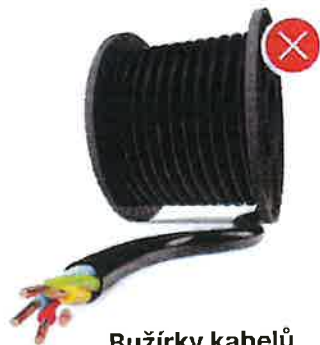
Bužírky kabelů Kabelové chráničky Elektrikářské lišty