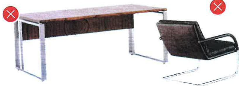
Stoly s kovovými součástmi