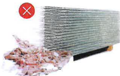
Stavební suť Sádkokarton