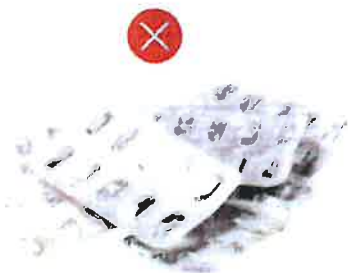
Blistry na tabletech