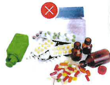
Obaly od léků