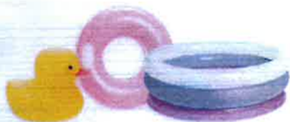
Dětské gumové hračky