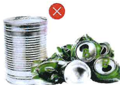
Železné a hliníkové plechovky