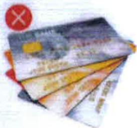
Plasty – typu platebních karet