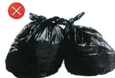
Uliční smetky Směsný komunální odpad