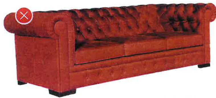
Sedačky s koženkovými potahy