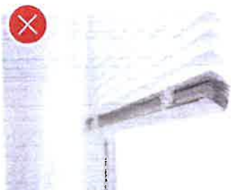
Plast – PVC žaluzie