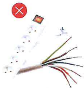
PVC – elektrické komponenty, bužírky z drátků