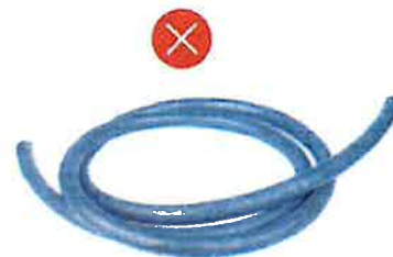
Plastové hadice, hadice na zalévání