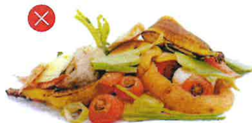
Odpady ze zeleně Bioodpad