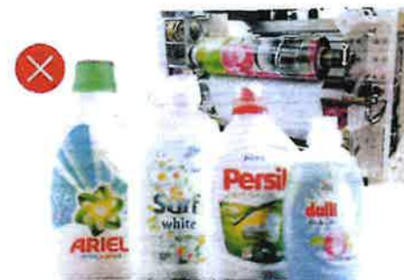
Celoetikety na plastových obalech potravin