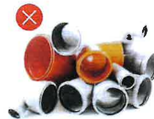
PVC trubky – instalátérské potrubí všechny druhy