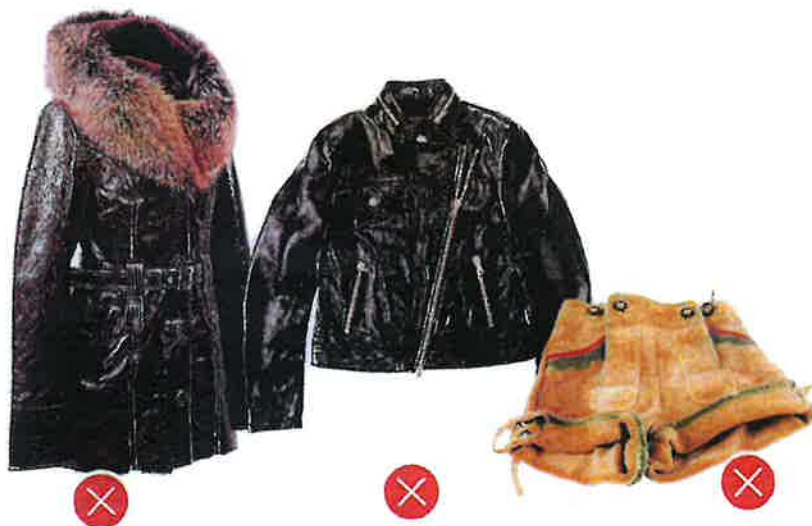
Oblečení z koženky