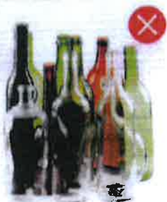
Skleněné lahvičky Obalové sklo